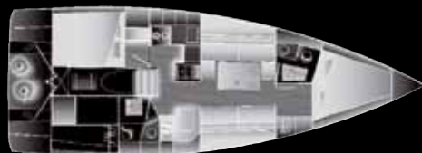
2 Cabines 2 salles d'eau / 2 Cabins 2 bathrooms