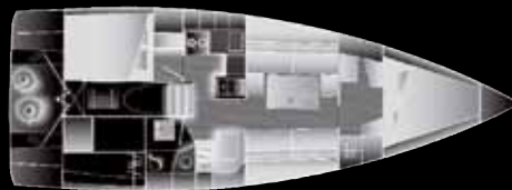
2 Cabines 1 salle d'eau / 2 Cabins 1 bathroom