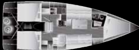
3 Cabines 1 salle d'eau / 3 Cabins 1 bathroom